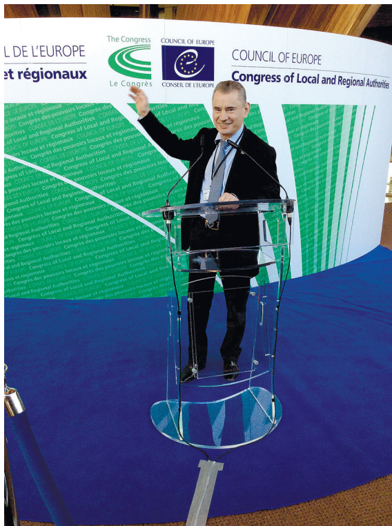
Курсы повышения квалификации. Совет Европы (Страсбург), март 2015 г.

Мысль об адвокатуре я вынашивал долго. Поводом для окончательного принятия решения стал разговор с товарищем, убедившим меня, что пора сменить деятельность и вступить в адвокатские ряды.