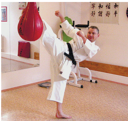
Тренировка по карате

Также хотелось бы высказать свое мнение о слиянии адвокатов с «армией юристов», к чему я отношусь скорее отрицательно. Не считаю, что среди