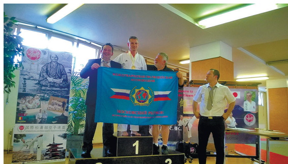
8. Европейские игры полицейских и пожарных, Брюссель 2014 г.

По китайскому гороскопу я собака (защитник-охотник). С детских лет готовил себя к защите Родины, в период службы в пограничных войсках защищал государственную границу, а сейчас – защищаю граждан.