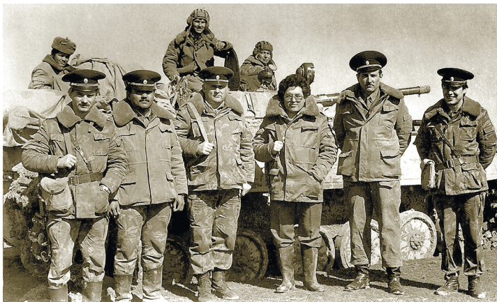
Подготовка к операции. Тахта-Базар, 2-я комендатура, 1990 г.